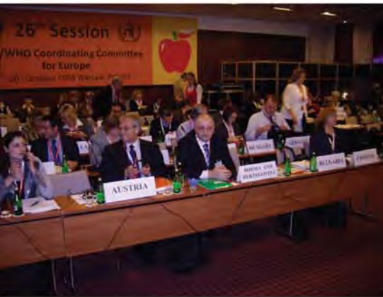
Агенција за безбједност хране Босне и Херцеговине, од свог оснивања до данас, ради на успостави државног система безбједности хране, а све у циљу доприноса високом нивоу заштите здравља потрошача и заштите интереса произвођача на подручју цијеле Босне и Херцеговине.

Нови концепт и политика безбједности хране у свијету последњих је деценија доживјела суштинску промјену у смислу преласка са контроле финалних производа на свеобухватни интегрисани систем безбједности – "од фарме до стола".