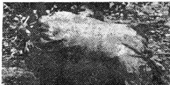
Sl. 2 — »Mješinski sir«

Prerada mlijeka u mješinski sir usko je povezana sa proizvodnjom kajmaka. Izrađuje se od obranog i djelimično obranog mlijeka, poslije proizvodnje kajmaka i obiranja vrhnja. Sir, proizveden od mlijeka s kojeg je dignut kajmak poznat je pod nazivom mješinski vareni sir. Ponekad se izrađuje i od cijelog nekuhanog mlijeka i naziva se cijeli mješinski sir. Način proizvodnje je vrlo jednostavan i jednak na cijelom ispitivanom području. Za ovaj sir, mlijeko se smlači i podsiri u većini slučajeva domaćim sirilom. Nakon usirivanja, gruša se lagano zagrijava i formira na dnu suda sirna gruda, surutka se zatim odlije, a sirna gruda se stavlja u krpu i pritisne