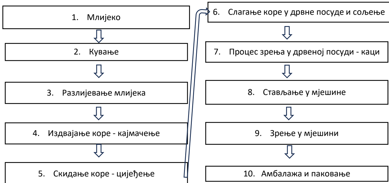
Процес производње кајмака из мјешине