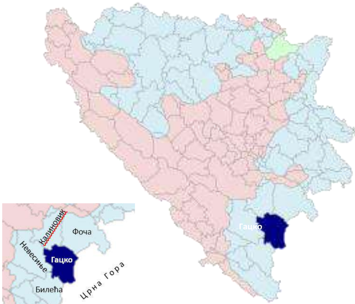
Карта географског подручја производње „Гатачког кајмака из мјешине“