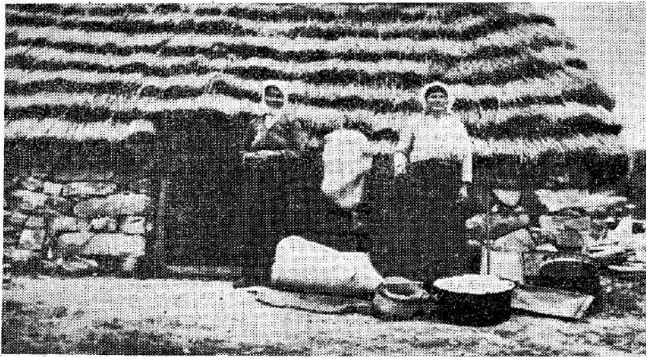
Sirna koliba u Danićima (Gacko) sa planiakama, te mješinama, kablom, stapom, kazanom, mećajicom i škipovima.